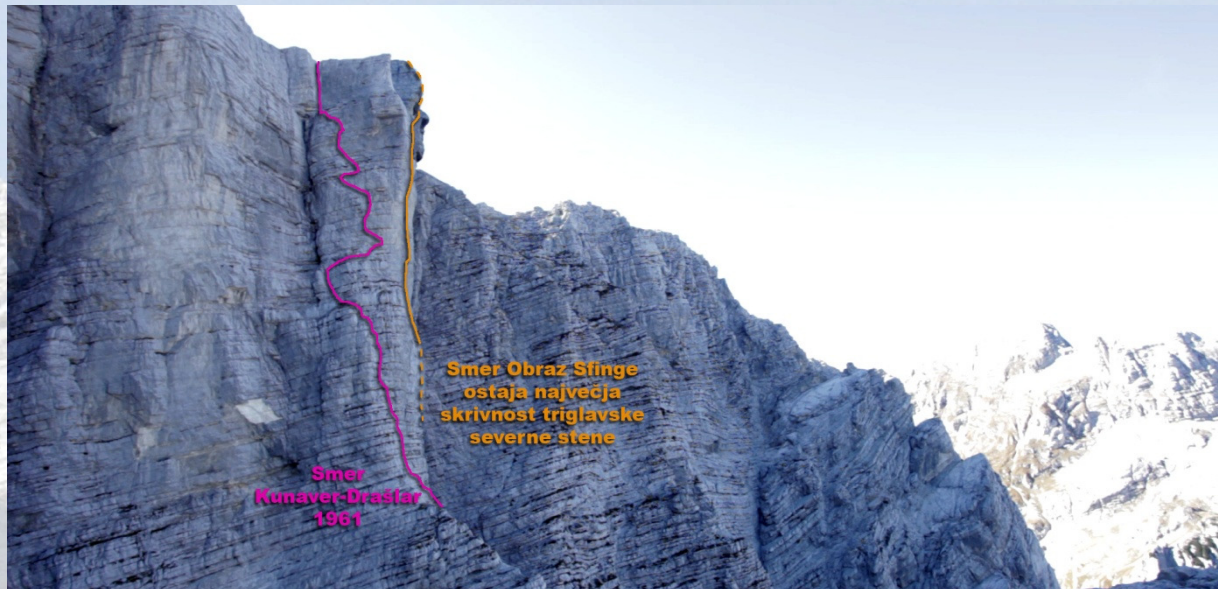
1961 – prva smer v Sfingi, a uganka ostaja nerazrešena.