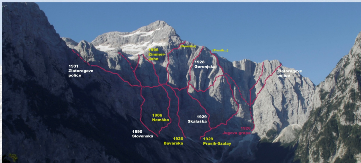
Smeri v Severni triglavski steni do leta 1931

značaja so v tej navidezni tekmi zmagali slovenski alpinisti, v večji meri zbrani v Turistovskem klubu Skala in imenovani kar skalaši.