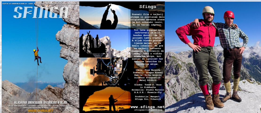
Reklamni plakati za film Sfinga

Slovenci smo kot izrazito močna alpinistična nacija prepoznavni tako rekoč povsod. Dejstvo, da gore predstavljajo pomemben kamen v mozaiku slovenske kulture, in zavedanje, da smo na avdio-vizualnem področju na njih v zadnjih letih nekoliko pozabili, pa je še dodatno klicalo k izvedbi takšnega projekta.