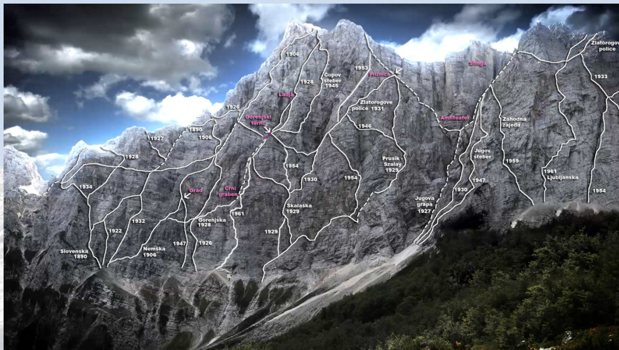
Smeri v Steni do leta 1961

Pred planinskim domom v Vratih že vrsto let stoji lična turistična tabla z vrisom smeri v triglavske steni, vanjo pa so vrisane vse najpomembnejše smeri Severne triglavske stene. Do šestdesetih let prejšnjega stoletja so plezalci prek stene že speljali množico smeri. Dotaknili so se večine do takrat logičnih razčlemb. Smeri so kot ovijalke prepletle Steno skoraj v celoti, njihovo skupno število pa se je povzpelo na več kot 30. Njen edini del, ki je kot povsem utopičen ostajal neosvojen in je med alpinisti zbujal strahospoštovanje, je bil monoliten, iz treh delov sestavljen vrtoglavi prepad tik pod robom Plemenic, triglavskega zahodnega grebena.