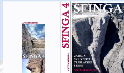
4. izdaja knjige Sfinga Antea Mahkote

Projekt Sfinga vključuje izdelavo dveh filmov – poleg osnovnega tudi film o tem, kako je zapleteno in nevarno snemanje Sfinge sploh potekalo – in izdajo dveh knjig. Ustvarjalci projekta so z njim poskušali pokriti področja oblikovanja narodne zavesti in alpinizma, ki je bil na domači zemlji s prvim vselej trdno povezan. Za prodor majhnega slovenskega filma širše v svet je to velika prednost.