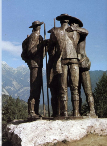
Ob 200-letnici prvega vzpona na vrh Triglava so štirim srčnim možem postavili spomenik v Bohinju.

Pozneje je preteklo več kot stoletje, da se je osvajanje gore nadaljevalo, sprva prek mednarodnostnega rivalstva pri gradnji planinskih zavetišč zdaj nemških, zdaj slovenskih domoljubov in se končno preselilo tudi v njegovo mogočno Severno steno. S stališča narodne zavesti v težavnem obdobju na prehodu iz 19. v 20. stoletje je enega najpomembnejših pečatov Slovincem nasploh vtisnil župnik Jakob Aljaž . Od občine Dovje je spretno odkupil sam vrh Triglava, z veliko mero pravniške spretnosti uredil lastniške pravice in dovoljenja in 7. avgusta 1895 prav na vrhu očaka postavil simbolično zavetišče, današnji Aljažev stolp. Dejanje brez primere!